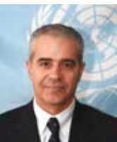
AHMED DJOGLAF Secretario Ejecutivo del Convenio sobre la Diversidad Biológica

Usted forma parte integral de la naturaleza; su destino está estrechamente unido a la biodiversidad, a la gran variedad de los otros animales y plantas, al lugar donde viven y a los entornos que los rodean en todo el mundo.