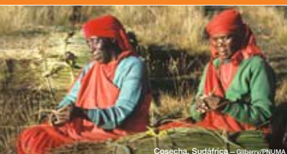
Cosecha, Sudáfrica

Invitamos a todas las personas del mundo a participar, a actuar a favor del medio ambiente a compartir sus experiencias con los demás.