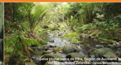
Selva pluvial cerca de Piha, Región de Auckland, Isla del Norte, Nueva Zelanda