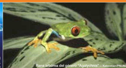
Rana arborea del género "Agalychnis"