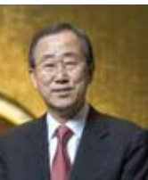
BAN KI-MOON Secretario General de las Naciones Unidas

Nuestras vidas dependen de la diversidad biológica. Algunos ecosistemas y especies están desapareciendo a un ritmo insostenible. Nosotros, los seres humanos, somos la causa.